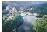
Stațiunea Sovata cu Lacul Ursu

- Sovata este o stațiune balneo-climaterică recunoscută atât în țară, cât și în străinătate, ca "paradis" al femeilor care visează să aibă copii. Ce puteri aparte are această așezare din mijlocul Transilvaniei?