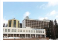
Baza de tratament Danubius

- Sigur că da. Practic, premenopauza durează, în medie, între doi și opt ani, depinde de la caz la caz. Ea este caracterizată, în principal, prin dezechilibrări hormonale, care conduc la tulburări de menstruație și fenomene vasoactive ale organismului, cum ar fi bufeurile, insomniile, modificările de dispoziție etc. Tratamentul local cu nămol și apă sărată este foarte eficient pentru asigurarea unui aport de estrogeni și progesteron natural în organism (hormoni pe care femeile nu-i mai au la menopauză). Tratamentele sunt foarte eficiente și reușesc să prelungească perioada până la apariția definitivă a menopauzei, la majoritatea pacientelor. În același timp, cura balneară la Sovata diminuează sau chiar anulează simptomele neplăcute induse de această stare.