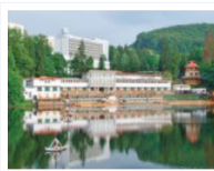
Lacul Ursu, sursa de nămol sapropelic peloidogen